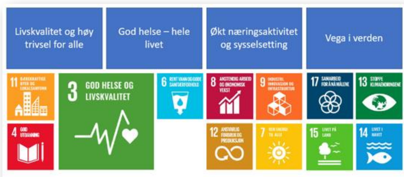
Vega kommunes hovedmål med FNs bærekraftsmål for 2023-2034

Hovedmålene innfrir kravene om at kommuneplanen skal ivareta mange hensyn samtidig som den er spisset mot å styrke den sosiale bærekraften. De fire hovedmålene presenteres nedenfor i prioritert rekkefølge: